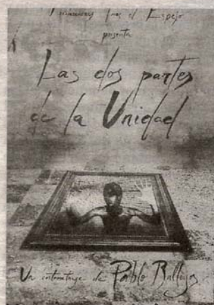
'Las dos partes de la Unidad'.